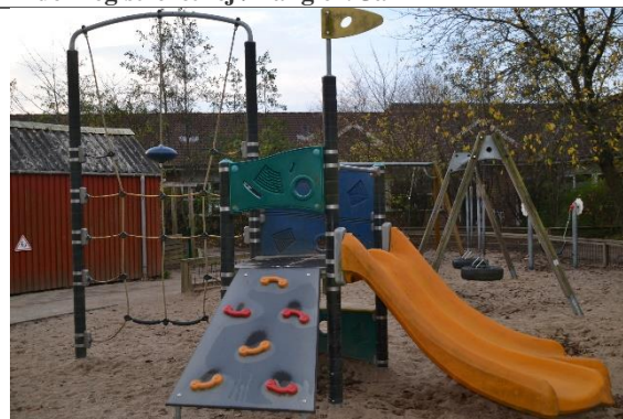
Redskab: Klatrestativ med rutsjebane Årgang: 2012 Producent: Kompan Er redskabet mærket: Ja Er der registreret fejl/mangler: Nej