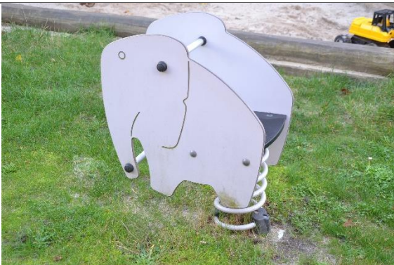
Redskab: Vippedyr Årgang: 2018 Producent: Hags Er redskabet mærket: Ja Er der registreret fejl/mangler: Nej