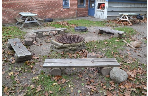
Redskab: Bålsted Ikke omfattet af DS/EN 1176