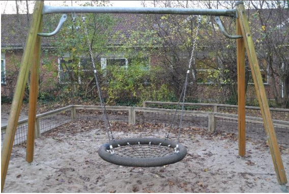
Redskab: Fugleredegynge Årgang: Producent: Er redskabet mærket: Nej Er der registreret fejl/mangler: Ja