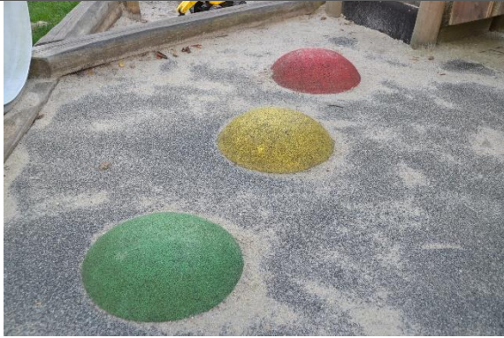
Redskab: Balancebobler Årgang: 2018 Producent: Hags Er redskabet mærket: Ja Er der registreret fejl/mangler: Nej