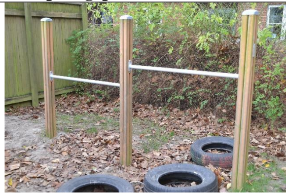
Redskab: Svingbom Årgang: 2008 Producent: Lappset Er redskabet mærket: Ja Er der registreret fejl/mangler: Ja