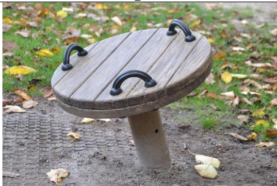
Redskab: Snurreplade Årgang: Producent: Er redskabet mærket: Nej Er der registreret fejl/mangler: Nej