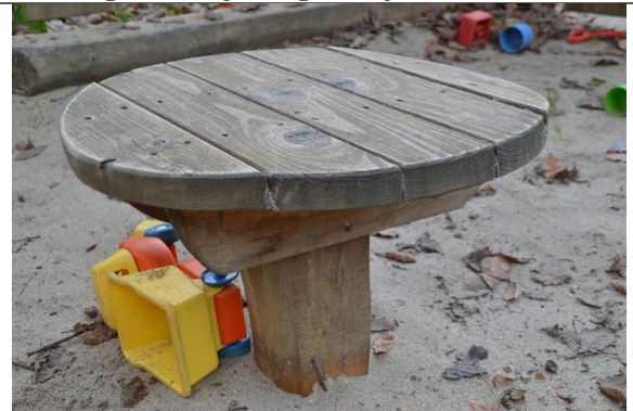
Redskab: Sandbord Årgang: 2018 Producent: Hags Er redskabet mærket: Ja Er der registreret fejl/mangler: Nej