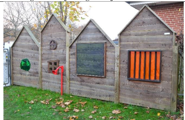
Redskab: Aktivitetsvæg Årgang: 2018 Producent: Hags Er redskabet mærket: Ja Er der registreret fejl/mangler: Nej