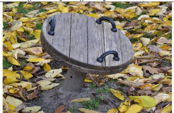
Redskab: Snurreplade Årgang: Producent: Er redskabet mærket: Nej Er der registreret fejl/mangler: Ja