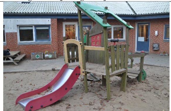
Redskab: Klatrestativ med rutsjebane Årgang: Producent: Kompan Er redskabet mærket: Ja Er der registreret fejl/mangler: Ja