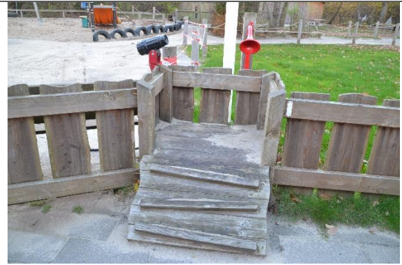
Redskab: Udkigspost Årgang: 2018 Producent: Hags Er redskabet mærket: Ja Er der registreret fejl/mangler: Nej