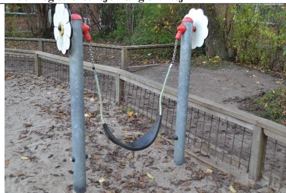
Redskab: Mavegyngte Årgang: 2012 Producent: Kompan Er redskabet mærket: Ja Er der registreret fejl/mangler: Nej