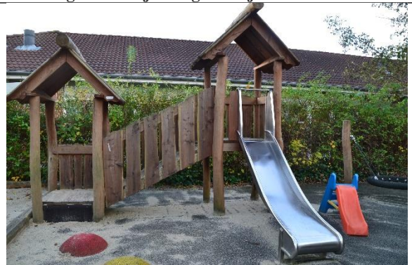
Redskab: Klatrestativ med rutsjebane Årgang: 2018 Producent: Hags Er redskabet mærket: Ja Er der registreret fejl/mangler: Ja