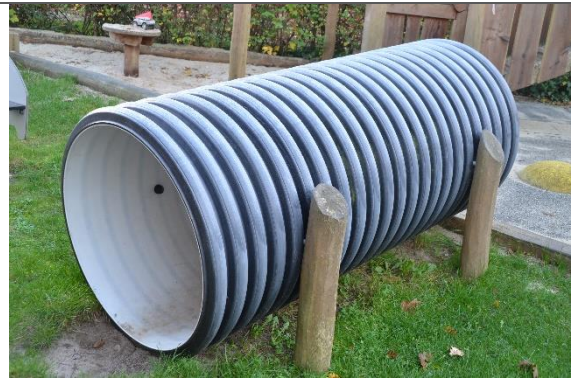
Redskab: Tunnel Årgang: 2018 Producent: Hags Er redskabet mærket: Ja Er der registreret fejl/mangler: Nej