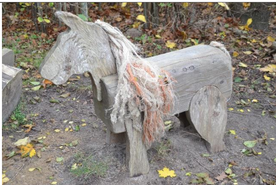
Redskab: Klatredyr Årgang: 2008 Producent: Er redskabet mærket: Ja Er der registreret fejl/mangler: Nej