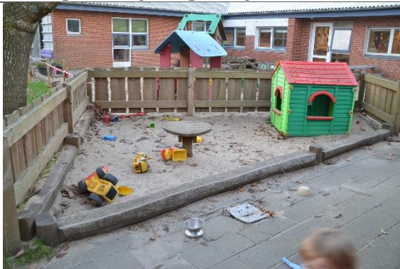
Redskab: Sandkasse Årgang: 2018 Producent: Hags Er redskabet mærket: Ja Er der registreret fejl/mangler: Nej