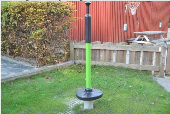
Redskab: Spinner Årgang: 2018 Producent: Hags Er redskabet mærket: Ja Er der registreret fejl/mangler: Nej