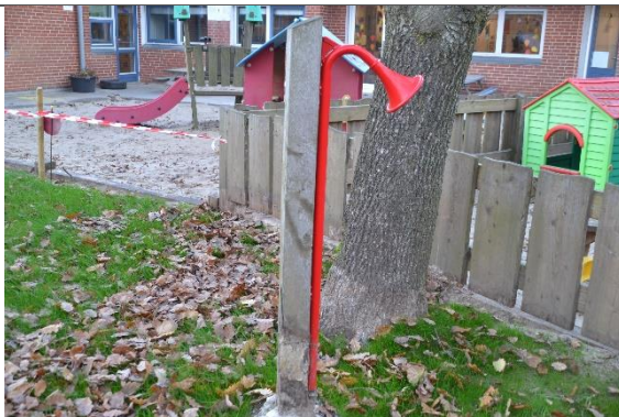
Redskab: Talerør Årgang: 2018 Producent: Hags Er redskabet mærket: Ja Er der registreret fejl/mangler: Nej