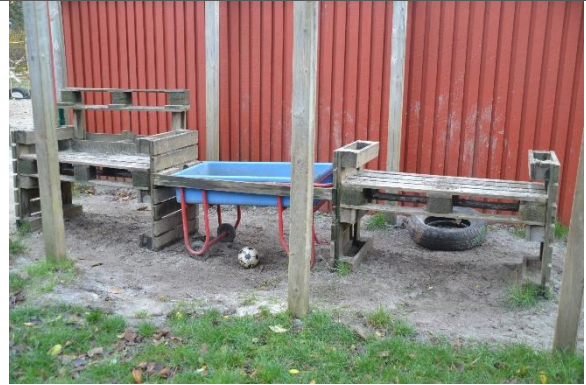
Redskab: Selvbyg Ikke omfattet af DS/EN 1176