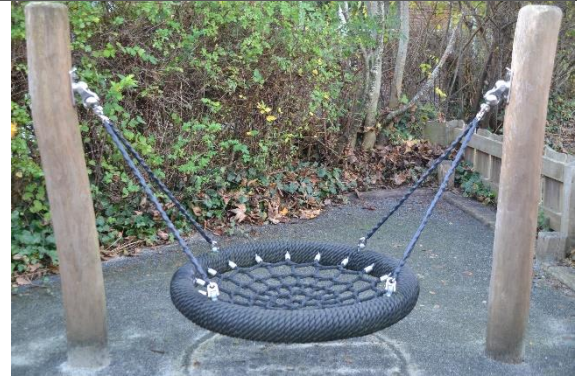
Redskab: Fugleredegynge Årgang: 2018 Producent: Hags Er redskabet mærket: Ja Er der registreret fejl/mangler: Ja