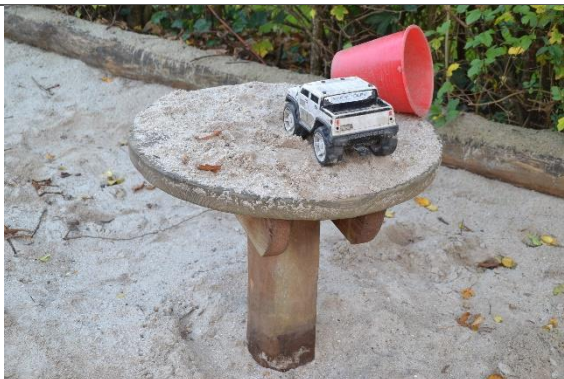
Redskab: Sandbord Årgang: 2018 Producent: Hags Er redskabet mærket: Ja Er der registreret fejl/mangler: Nej