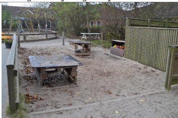
Redskab: Sandkasse Årgang: Producent: Er redskabet mærket: Nej Er der registreret fejl/mangler: Nej