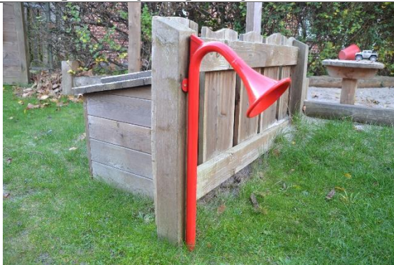
Redskab: Talerør Årgang: 2018 Producent: Hags Er redskabet mærket: Ja Er der registreret fejl/mangler: Nej