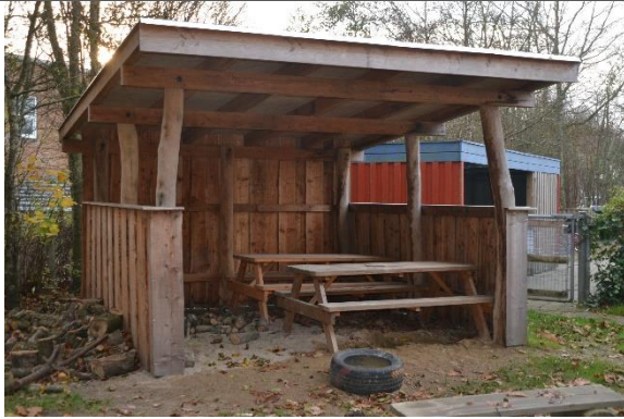
Redskab: Madpakkehus Ikke omfattet af DS/EN 1176