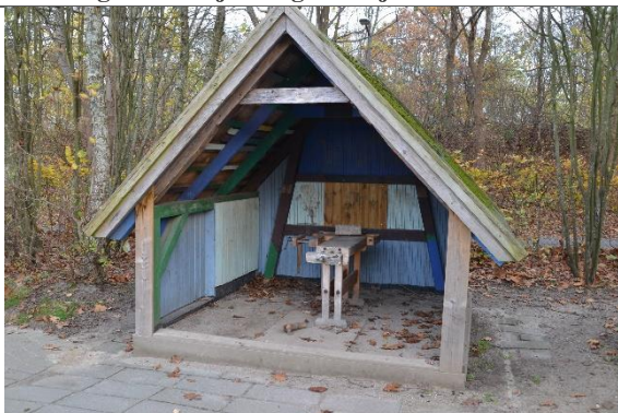
Redskab: Legeværksted Ikke omfattet af DS/EN 1176