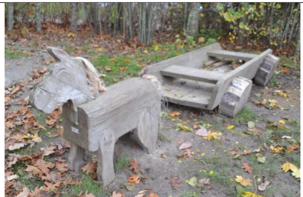
Redskab: Klatredyr og vogn Årgang: 2008 Producent: Er redskabet mærket: Ja Er der registreret fejl/mangler: Nej