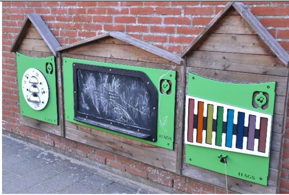
Redskab: Instrumenter Årgang: 2018 Producent: Hags Er redskabet mærket: Ja Er der registreret fejl/mangler: Nej