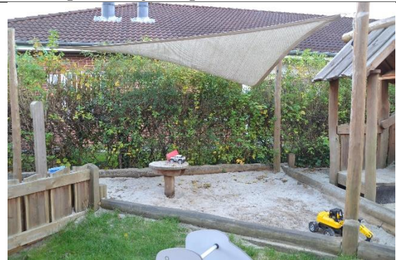
Redskab: Sandkasse med stolper til læsejl Årgang: 2018 Producent: Hags Er redskabet mærket: Ja Er der registreret fejl/mangler: Nej