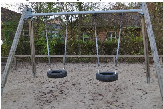
Redskab: Gyngestativ Årgang: 2012 Producent: Kompan Er redskabet mærket: Ja Er der registreret fejl/mangler: Nej